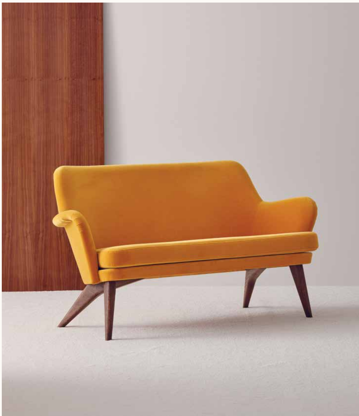
PEDRO-SOHVA PEDRO SOFA 1952