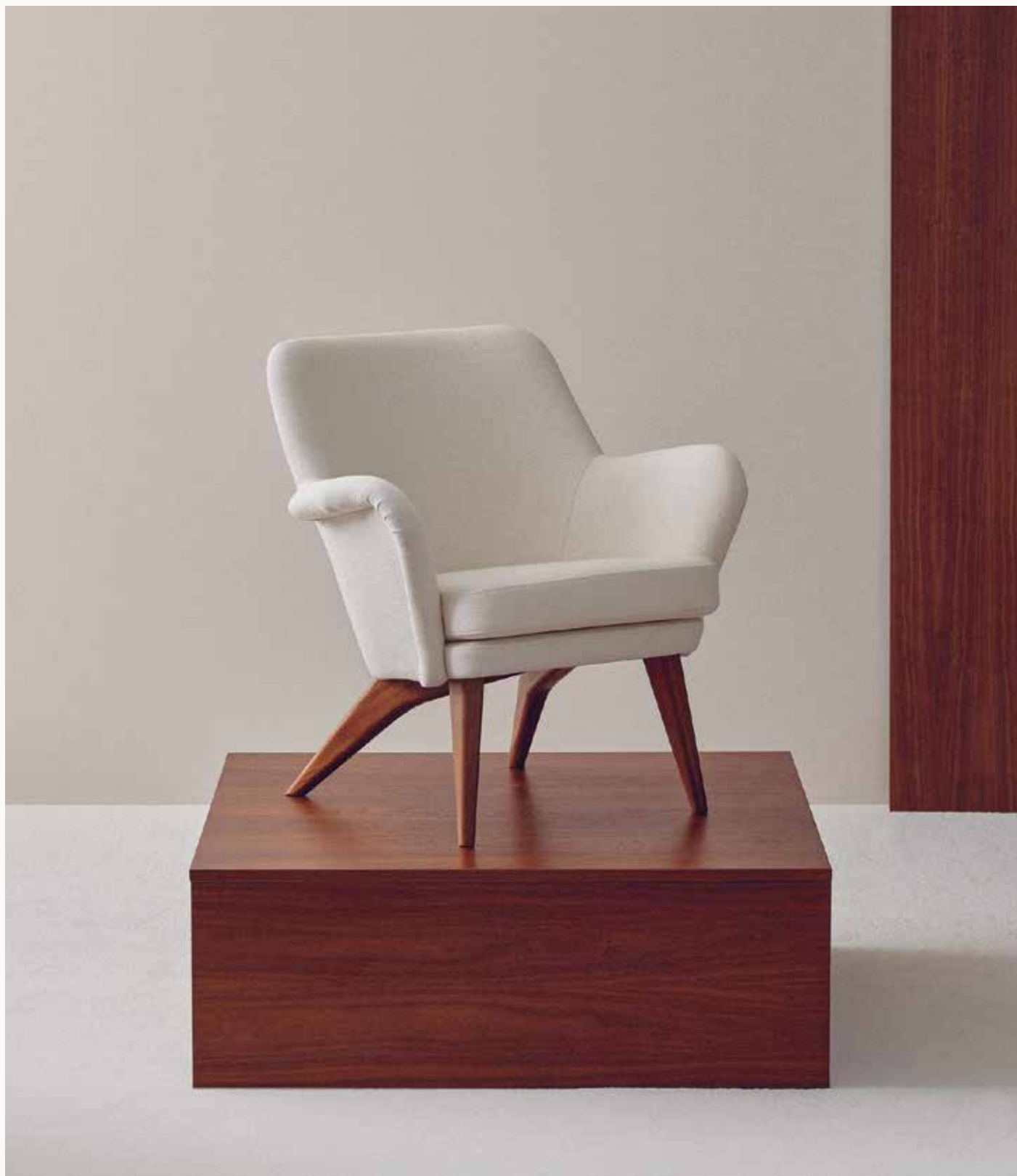
PEDRO-NOJATUOLI PEDRO LOUNGE CHAIR 1952