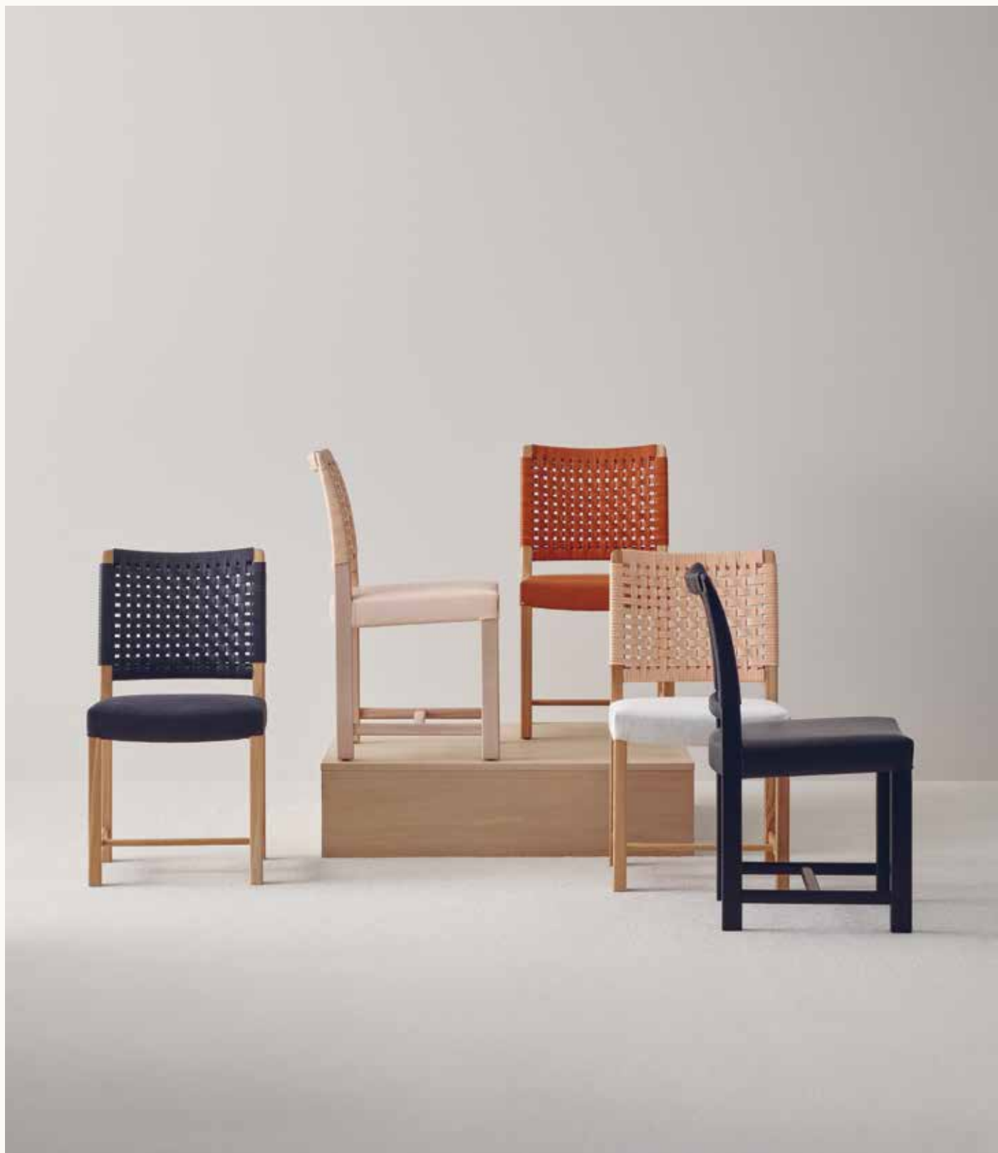
NÄYTTELY-TUOLI NÄYTTELY CHAIR 1955